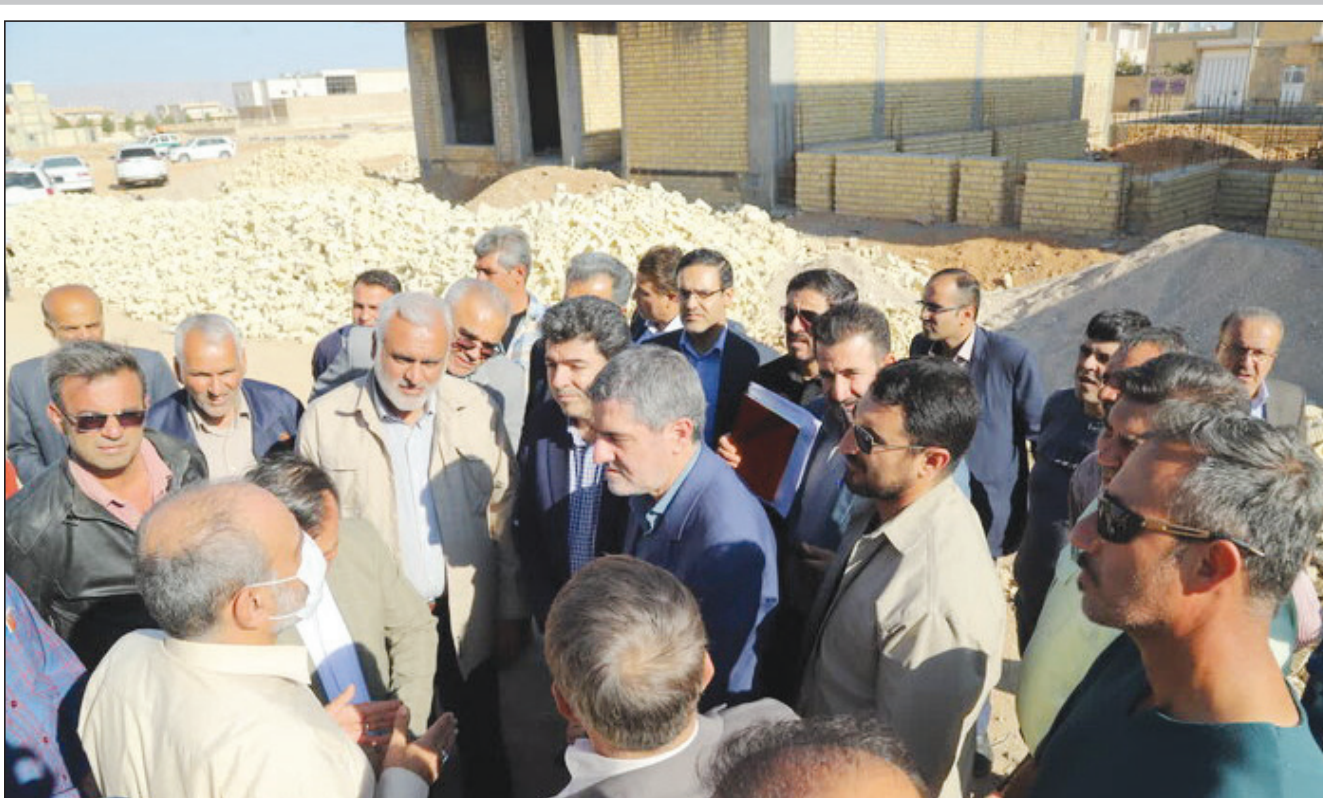
خرامه و سروستان فارس در مسیر صنعتی شدن؛ از ظرفیت‌ها تا چشم‌اندازها

دستور رئیسی در مورد تدوین برنامه تحقق سیاست‌های کلی توسعه دریامحور