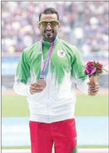
۵۱ صدم ثانیه به مدال طلا رسید. در این ماده شش ورزشکار به رقابت با یکدیگر پرداختند.