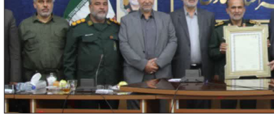
شیراز سومین حرم اهل بیت در ایران اسلامی

رئیس شورای اسلامی شهر شیراز با بیان اینکه تعامل مجموعه شهرداری و شورای اسلامی شهر شیراز با سپاه فجر قابل توجه و در سطح بسیار خوبی است، گفت: هدف ما شادی و رضایت بسیار است و با کمک و همکاری سپاه فجر با مدیریت شهری شیراز اتفاقات خوبی افتاده است و بر این باوریم که می تواند بهتر از این هم اتفاق بیفتد. وی با اشاره به این نکته که حوزه فرهنگ پیش از سایر حوزه ها نیاز به سیاست گذاری دارد، گفت: آنچه در نظام جمهوری اسلامی نیازمند کار و تلاش بیشتر است، حوزه فرهنگ است؛ چرا که فرهنگ، خمیر مایه سایر فعالیت های اجتماع است و امیدواریم با تداوم همکاری ها بین شهرداری و سپاه فجر استان فارس، شاهد خدمات بهتر و شایان توجهی به شهروندان باشیم.