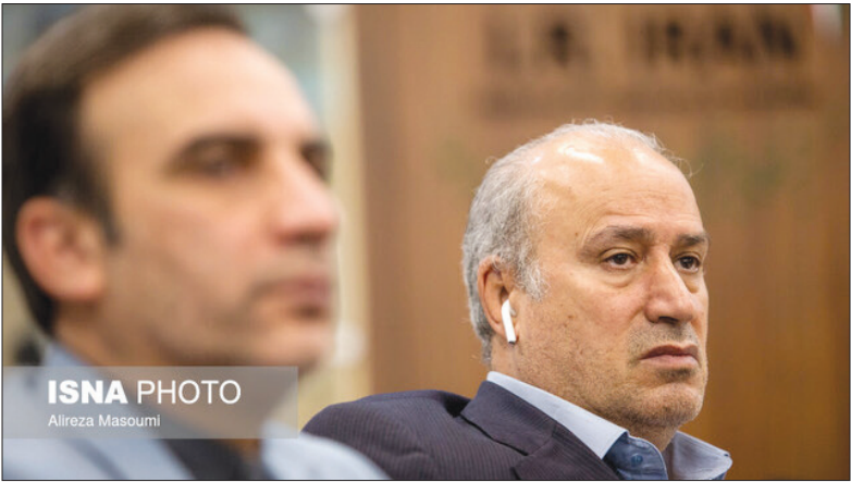
رئیس فدراسیون فوتبال ایران، علی‌رضا بیرانوند

خرج کردیم که باید این کار را انجام می‌دادیم. او با بیان اینکه امسال هنوز نتوانسته‌ایم تحریم‌ها را رفع کنیم، ادامه داد: اگر همه پول‌هایمان را که در فیفا بلوکه هستند، آزاد کنیم نه تنها از دولت کمک نمی‌گیریم شاید به وزارت ورزش هم کمک کنیم، اما وقتی پول‌ها بلوکه شده نمی‌توانیم. شاید ۱۰ جلسه با مسئولان فیفا داشتیم و آنها گفتند مشکل از بانک‌هاست. البته بخشی از هزینه‌های VAR، چمنی که به زودی می‌آوریم و ساختنمانی که می‌سازیم از همان پول‌های بلوکه شده است.