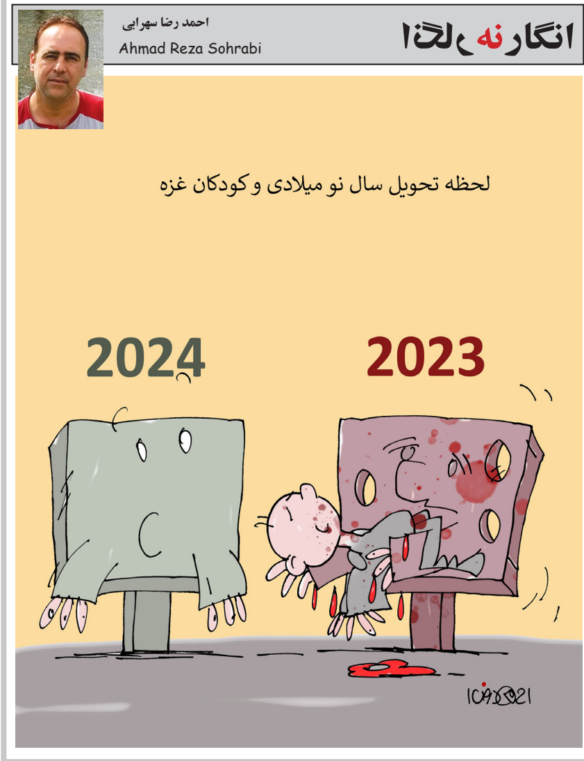
لحظه تحویل سال نو میلادی و کودکان غزه

ایرنا: وزیر فرهنگ و ارشاد اسلامی با بیان اینکه مخالف محدودسازی سینما هستیم گفت: نگاه ما در سینما توسعه‌ای، گشایش و افتتاح است و با نگاه‌هایی که به دنبال محدودسازی سینما و کار هنری است حتماً مخالفیم. به گزارش ایرنا، محمد مهدی اسماعیلی دیروز سه‌شنبه در حاشیه آیین پایانی ششمین جایزه پژوهش سسال سینمای ایران در جمع خبرنگاران در پاسخ به سوال درباره نگاه وزارت فرهنگ و ارشاد اسلامی نسبت به سینما اظهار داشت: اتفاقات خوبی در سینما افتاده است؛ سینمای ایران سال بی‌ظنیری را به لحاظ میزان مخاطب و فروش و نیز کارهای زیرساختی که در حال انجام است، تجربه می‌کند. وی گفت: در آستانه رسیدن به ۹۰۰ سالن سینما هستیم. آن هم در یک شرایط دشوار در طول دو سال و نیم اخیر بیش از ۳۰۰ سینما به مجموعه سینماهای کشور اضافه شده که این افتخار همه اهالی سینماست. اسماعیلی افزود: نگاه ما در سینما توسعه‌ای، گشایش و افتتاح است و با نگاه‌هایی که به دنبال محدودسازی سینما و کار هنری است حتماً مخالفیم. وزیر فرهنگ گفت: در عین حال از اصحاب سینما و همه افراد خواسته ما این است که از دستاوردها حمایت کنند. در سینمای ایران، فیلم پویانمایی ما بالای ۵۰ میلیارد تومان فروخته است که داستان مذهبی دارد و مردم علاقه دارند و این‌ها مایه افتخار جامعه هنری ماست. اسماعیلی گفت: امیدوارم همه دلسوزان صنعت سینما و هنر سینما کنار هم باشند و با خوش خلقی و انعطاف به تعالی سینما کمک کنند. وی در پاسخ به دیگر سوال ایرنا در خصوص