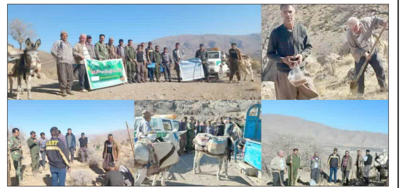
داوریزدانی / ارسنجان

در راستای اجرای طرح کاشت یک میلیارد درخت و در آستانه ولادت حضرت علی (ع) و روز بذر دهمین پوشش بذرکاری توام با برگزاری کارگاه آموزشی توجیهی باشعار زاگرس سبزی و نذر سبزی مادری باهماهنگی انجام شده با ناظر طرح مترصداری لای بازار و دوزرد مهندس داریوش خلیوند با حضور سبزی تعدادی از دامداران و مرتعداران مرتع مذکور و حضور رئیس معاونت و کارشناسان منابع طبیعی شهرستان ارسنجان با استفاده از بذور بادام کوهی، بنه وارژن و تنگرس قسمتی از مرتع بنام جونو واقع در ارتفاعات کوه سیاه و مرتع لای بازار و دوزرد از ساعت اولیه صبح آغاز و بذرکاری انجام پذیرفت و تا اواخر روز ادامه پیدا کرد.