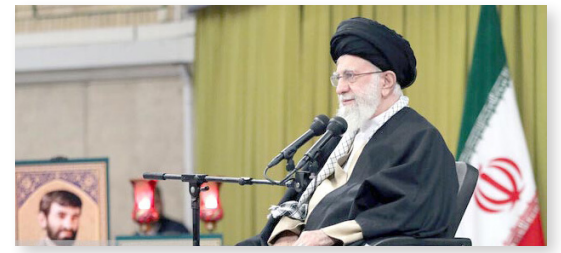
رهبر انقلاب اسلامی خطاب به مسئولان کشورهای اسلامی تاکید کردند لزوم قطع شریان‌های حیاتی رژیم صهیونیستی