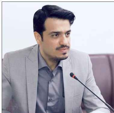
صاف صدر دوام

معاون تحقیقات و فناوری دانشگاه علوم پزشکی شیراز گفت: هم اکنون در جوامع بشری رسیدن به دانشگاه نسل سوم از اهمیت ویژه ای برخوردار است.