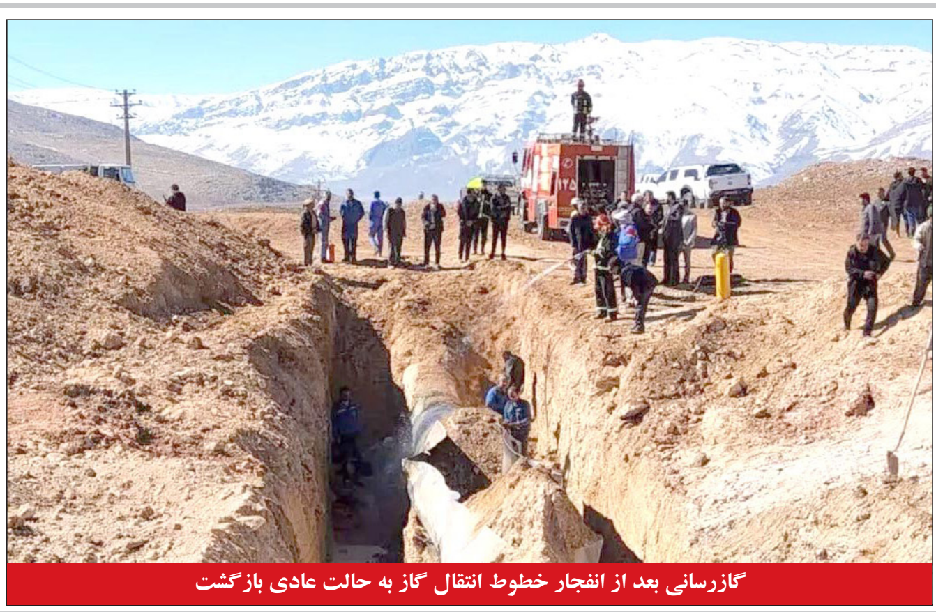
گازرسانی بعد از انفجار خطوط انتقال گاز به حالت عادی بازگشت