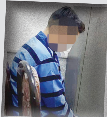
دوم دادرسی امور جنایی تهران، متهم در اختیار کارآگاهان اداره دهم پلیس آگاهی پایتخت قرار داده شد و تحقیقات در این خصوص ادامه دارد.

همزمان با مرگ یک پسر جوان و کم‌بینا شدن دوستش بر اثر مصرف مشروبات الکلی دست‌ساز مرد قهوه‌خانه‌داری به اتهام فروش مشروب تقلبی بازداشت شد. به گزارش باشگاه خبرنگاران جوان، چندی قبل، مرگ پسر جوانی در یکی از بیمارستان‌های پایتخت به بازپرس حمیدرضا کیاستی اعلام شد. به‌دنبال اعلام این خبر، تحقیقات به دستور بازپرس جنایی آغاز و در بررسی‌ها مشخص شد، پسر جوان سه روز قبل به بیمارستان منتقل شده و تلاش کادر درمان برای نجات جانش بی‌نتیجه مانده است. متخصصان پزشکی قانونی نیز پس از بررسی علت مرگ پسر جوان مسمومیت با الکل متانول را به عنوان عامل اصلی مرگ تشخیص دادند. در ادامه یکی از دوستان پسر جوان که در بیمارستان بود به مأموران گفت: شب حادثه به همراه ۵ نفر از دوستانم در پارک دورهمی گرفتیم، آن شب من و دوستانم مشروب الکلی دست‌ساز خوردیم. دوستان دیگرم زمانی که فهمیدند مشروبات دست‌ساز است و از آنجایی که خبرهای زیادی در رابطه با مرگ و کوری افرادی که مشروبات الکلی دست‌ساز می‌خورند شنیده بودند، ترسیدند و مشروب نخوردند. البته حق هم داشتند، چون من و دوستانم با خوردن مشروب حال‌مان بد شد و ما را به بیمارستان بردند. دوستانم جان باخت من هم دچار کم‌بینایی شدم. او ادامه داد: ما مشروب را از یک مرد قهوه‌خانه‌دار خریدیم، ما به قهوه‌خانه او رفت و آمد داشتیم و کم‌کم با او دوست شدیم. هاشم، صاحب قهوه‌خانه، مشروبات