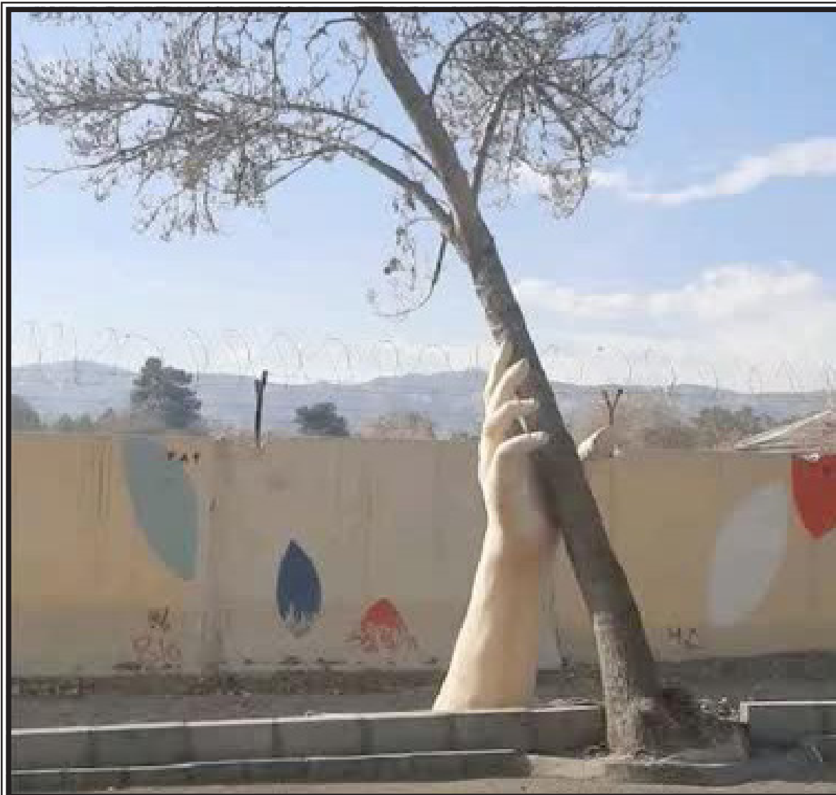
چشم شیشه ای