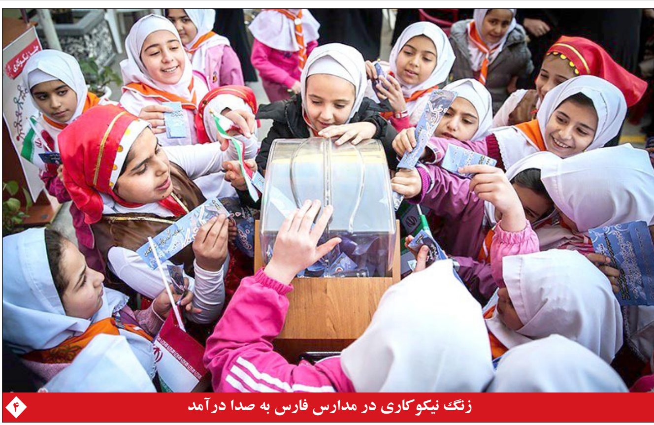
زتگ نیکوکاری در مدارس فارس به صدا درآمد