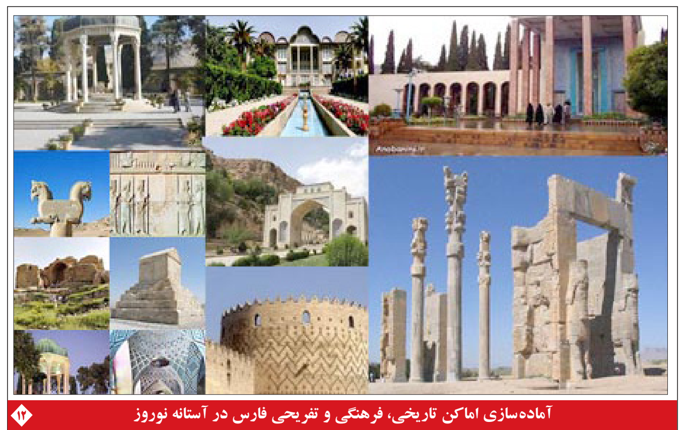
آماده سازی اماکن تاریخی، فرهنگی و تفریحی فارس در آستانه نوروز