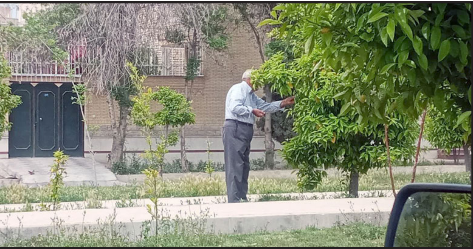
زمان هستی درختان فارنج

نماینده عالی دولت در فارس با اشاره به اینکه بیش از ۲۰۰ قفله حادثه خیز اوایل دولت سیزدهم در فارس شناسایی شد گفت: با حمایت های شخص ریاست محترم جمهوری و مرحوم رستم قاسمی وزیر نفت در تأمین منابع مالی بیش از ۱۰۰ قفله از این نقاط مرتفع شده است؛ ۹۸ قفله دیگر باقی مانده است که وزارت راه و شهرسازی متعهد شده است تا پایان امسال این تعداد هم به سرانجام برسد.