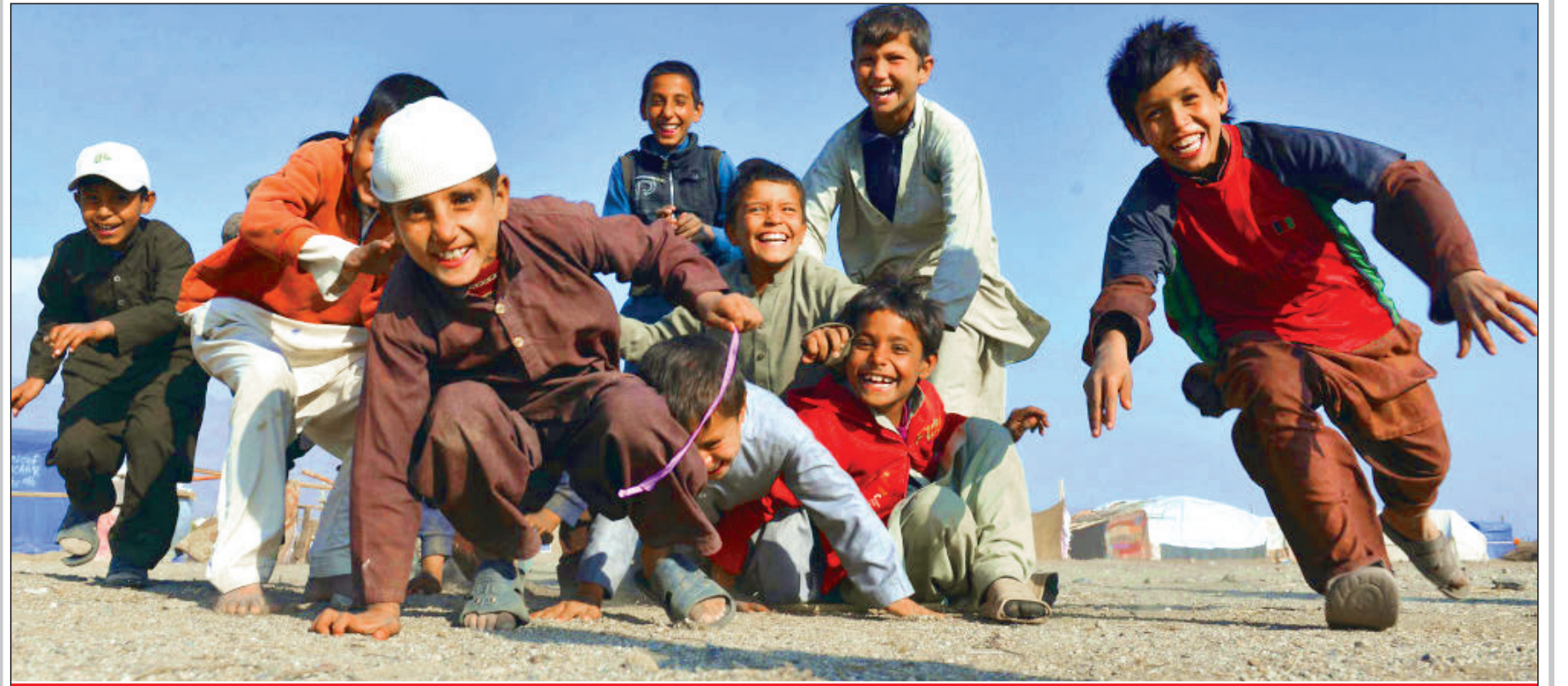
کراماتی تحلیلگر مسایل خاورمیانه و افغانستان در گفت و گو با «عصر مردم»: شمار مهاجرین خارجی غیرمجاز در فارس بیش از اروپاست