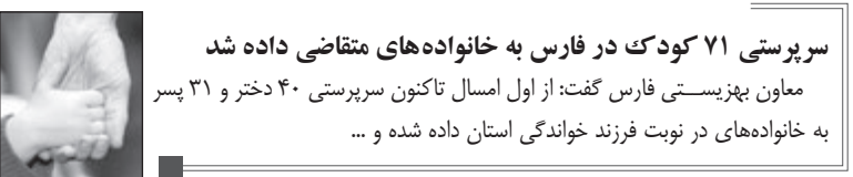
سرپرستی ۷۱ کودک در فارس به خانواده های متقاضی داده شد معاون بهزیستی فارس گفت: از اول اسفند تاکنون سرپرستی ۴۰ دختر و ۳۱ پسر به خانواده های در نوبت فرزند خواندگی استان داده شده و ...