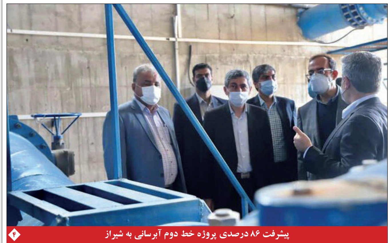
پیشرفت ۸۶ درصدی پروژه خط دوم آبرسانی به شیراز