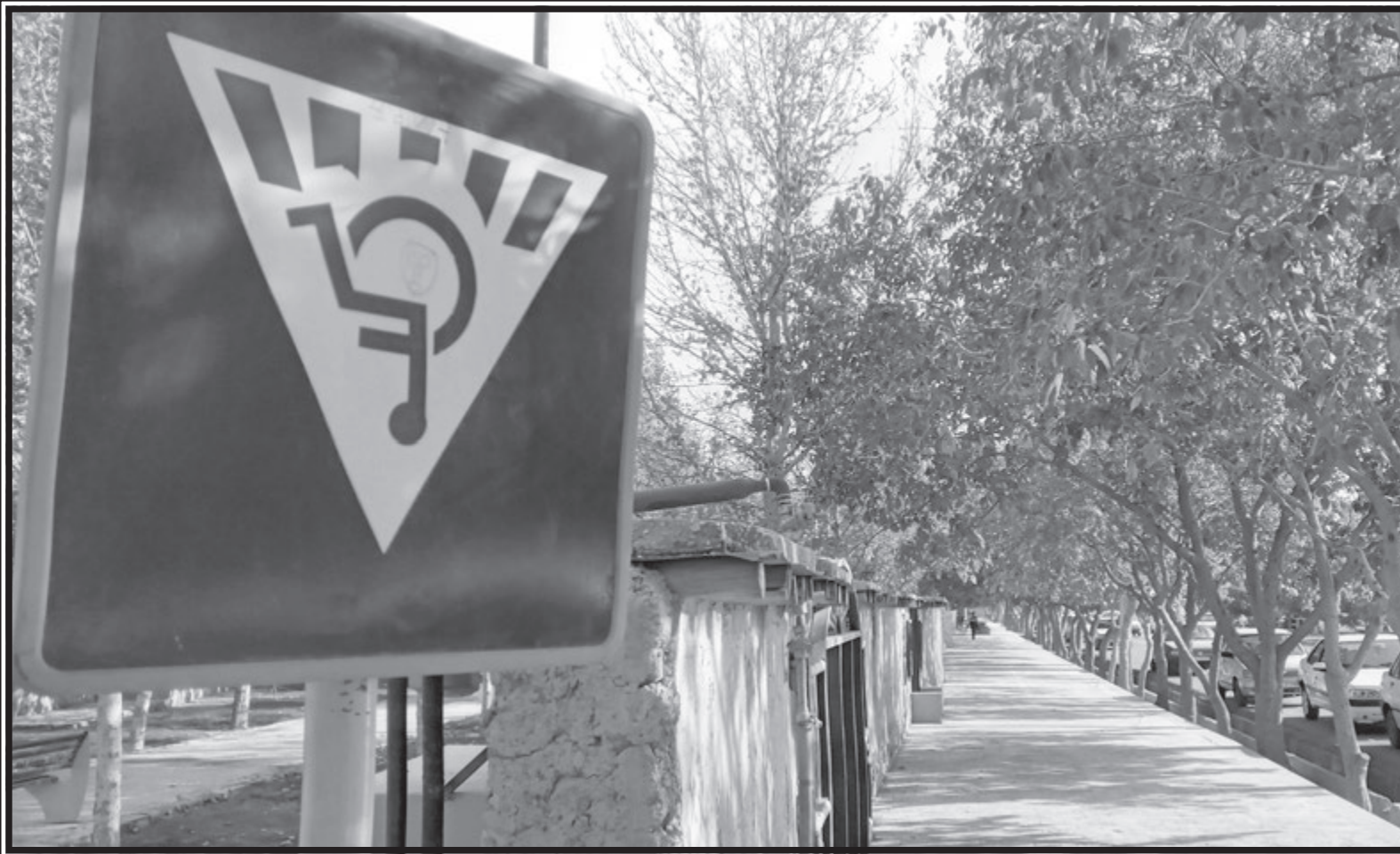
چشم شیشه ای