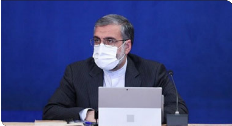
رئیس دفتر رئیس جمهور