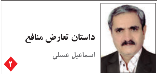
داستان تعارض منافع اسماعیل عسلی