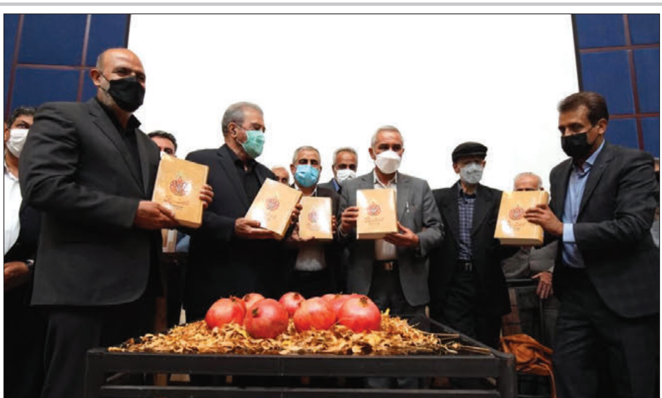
رونمایی از «انارستان عشق»، روایتی از تاریخ چهار هزارساله ایج استهبان

رئیس ستاد امر به معروف و نهی از منکر: مخاطب شناسی و زمان شناسی باشیم معاون ستاد امر به معروف کشور: ظرفیت مردمی در این فریضه کارسازتر است انتصاب یک مدیر کل و دو سرپرست سازمان در شهرداری شیراز در بازدید استاندار فارس مطرح شد: فاز ۶ شهرک صنعتی بزرگ شیراز به زودی به مرحله واگذاری می‌رسد درخواست نماینده فیروزآباد از وزرای راه و نفت برای رفع مشکل جاده فیروزآباد به صورت ویژه