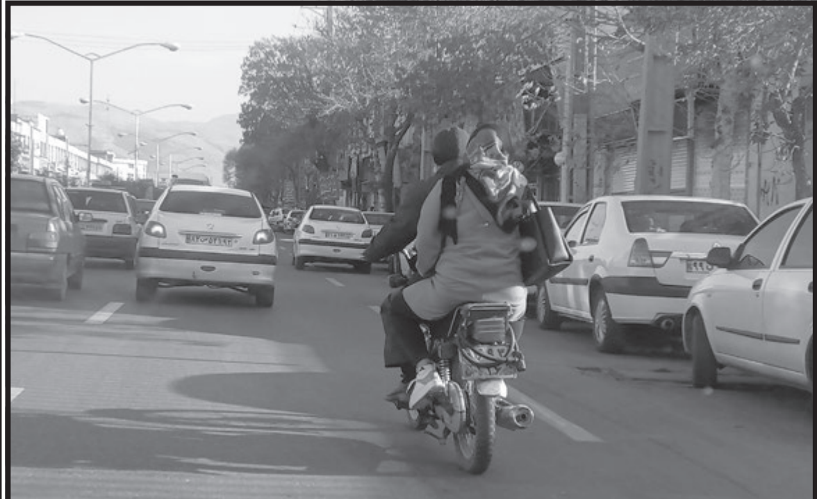
عکس: علی گزیند / عصر مردم | عکس: فرشته منصوری | بانوانی که تنها یک مادر و یک پدر نیستند | چشم شیشه‌ای | عکس: علی گزیند / عصر مردم | با جان عزیزان قمار کنیم، این بازی سرزندگیست!