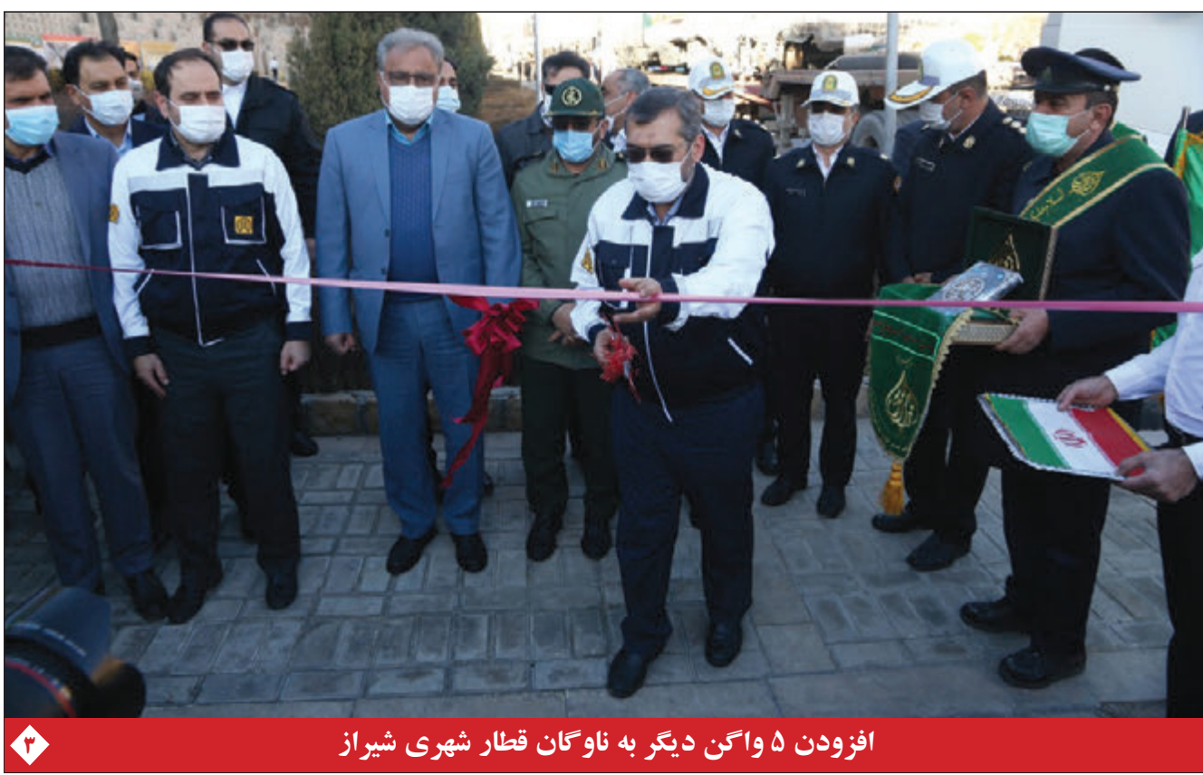
افزودن ۵ واگن دیگر به ناوگان قطار شهری شیراز