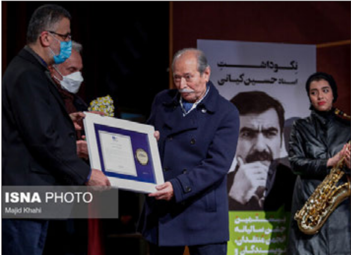
اصلاحی، فیلمساز روی صحنه رفتند.

او که چندی پیش برای نجات یک زندانی محکوم به اعدام