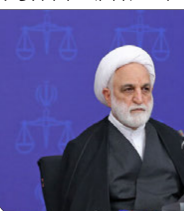
محسنی ازهای: بنای مربوط به قوه قضاییه در حاشیه رود چالوس تخریب شود

کارکنان شهرداری و پیمانکاران را دربر می گیرد. این پرونده ۵۱ متهم دارد که شهردار سابق لوسان، اعضای شورای شهر لوسان، برخی از کارمندان شهرداری و پیمانکاران را دربر می گیرد.