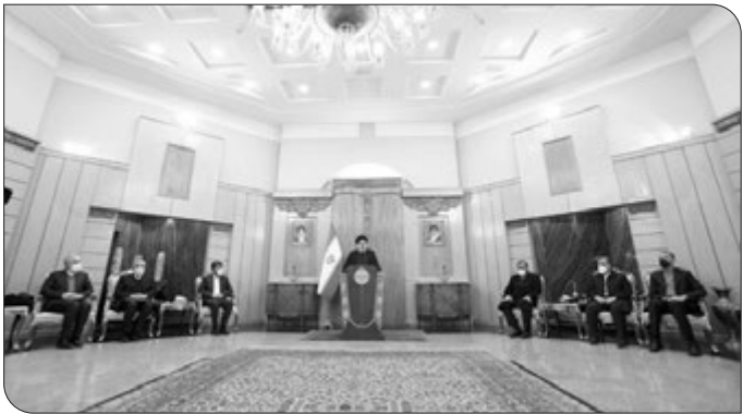
رئیس جمهور گفت: امیدوارم سفر به روسیه نقطه عطفی برای ارتقای روابط با کشور دوست و همسایه روسیه باشد و مجموعه این روابط به ارتقای سطح امنیت در منطقه و رفع بحران‌های منطقه‌ای و جهانی کمک کند.

به گزارش ایسنا، آیت‌الله سید ابراهیم رئیسی با امداد جمعه در بازگشت از سفر دو روزه به روسیه در گفتگو با خبرنگاران درباره دستاوردهای این سفر گفت: مباحث مطرح شده در این سفر در راستای تحقق اهداف کلان سیاست خارجی جمهوری اسلامی ایران یعنی تعامل حداکثری با کشورهای جهان و به ویژه کشورهای همسو و هم‌پیمان با ایران بود.