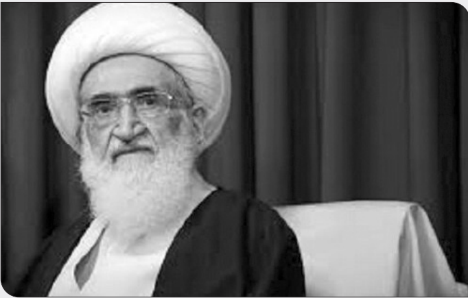
از سوی بانک‌ها افزود: قرآن دو گناه را بسیار نکوهش فرموده، نخست پندرش دلت و قبول

شفقنا نوشت: آیت‌الله العظمی نوری همدانی با انتقاد از کاهش ارزش پول ملی کشور خاطرنشان کردند: ارزش پول ملی ما در مقایسه با بسیاری از کشورهای پایین است، ما باید اشکالات موجود در این زمینه را رفع کنیم. زمانی با ۳۰ هزار تومان می‌شد خانه خرید، اما الان یک کیلو میوه هم نمی‌دهند!