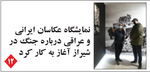
نمایشگاه عکاسان ایرانی و عراقی درباره جنگ در شیراز آغاز به کار کرد