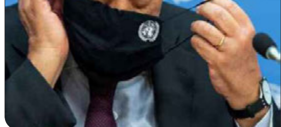
گوترش گفت، شورای امنیت سازمان ملل که قدرت حفظ صلح و امنیت بین المللی از جمله با اعمال تحریم ها و دستور به اقدام نظامی را دارد، دچار چند دستگی به ویژه در میان پنج عضو دائمی که دارای حق وتو هستند شده است. روسیه و چین اغلب بر سر مسائل کلیدی با آمریکا، انگلیس و فرانسه اختلاف دارند که از جمله پنجشنبه در مورد تحریم های جدید علیه کره شمالی، نمود یافت.

گوترش گفت: دبیرکل سازمان ملل هیچ قدرتی ندارد، ما می توانیم نفوذ داشته باشیم، من می توانم متقاعد کنم، من می توانم میانجیگری کنم اما هیچ قدرتی ندارم.