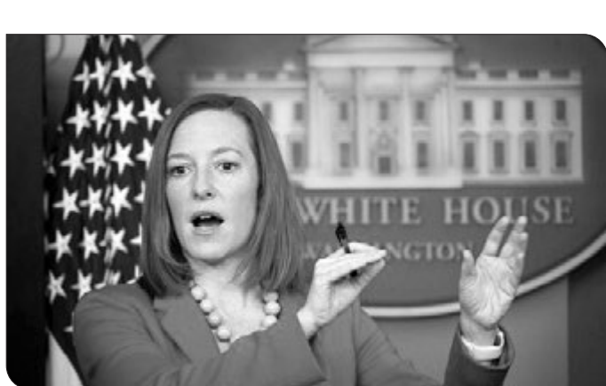
معاون هماهنگ کننده ارتش با بیان اینکه تقویت همکاریهای دریایی و ارتقای امنیت تجاری بین المللی دریایی و مقابله با دزدی دریایی و تروریسم دریایی از جمله اهداف گشت‌های بهتر و فرماندهی‌ها و البته تبادل تجاریات دریایی در امدارسانی و کمک در حوادث و سوانح دریایی از آن جمله است.

امیر دریادار سیاری همچنین تصریح کرد: برگزاری مقترانه این رزمایش با میزبانی فرماندهی ما نشان می‌دهد نیروهای دریایی جمهوری اسلامی ایران متشکل از ارتش و سپاه از توانمندی بسیار خوبی در برنامه‌های