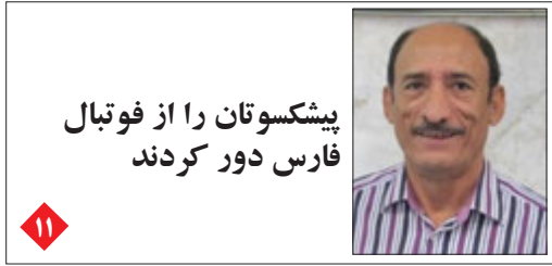
پیشکوتان را از فوتبال فارس دور کردند