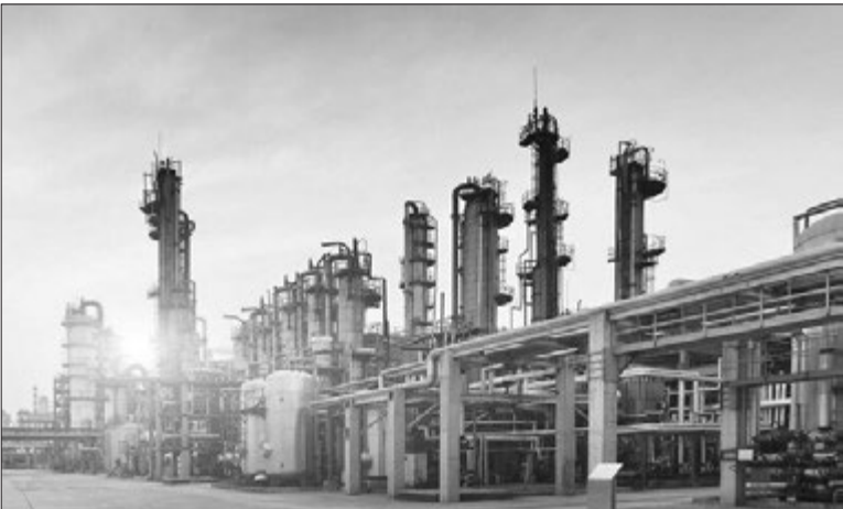
کارخانه تولید متانول در استان فارس

به گفته کریمایی بهتر است دولت و نمایندگان مجلس، تبعات اینگونه تصمیمات را بیش از آنچه مورد بررسی قرار داده‌اند، بررسی کنند، چرا که اگر بدهایی این‌چنینی در قانون بودجه ۱۴۰۱ تصویب شود، تبعات آن برای اقتصاد کشور غیرقابل جبران خواهد بود و ضرب‌های که به صنعت پتروشیمی زده می‌شود نیز در روند توسعه این صنعت، هم در میزان ارزآوری آن و هم در از دست رفتن بازارهای صادراتی، قابل ملاحظه خواهد بود.