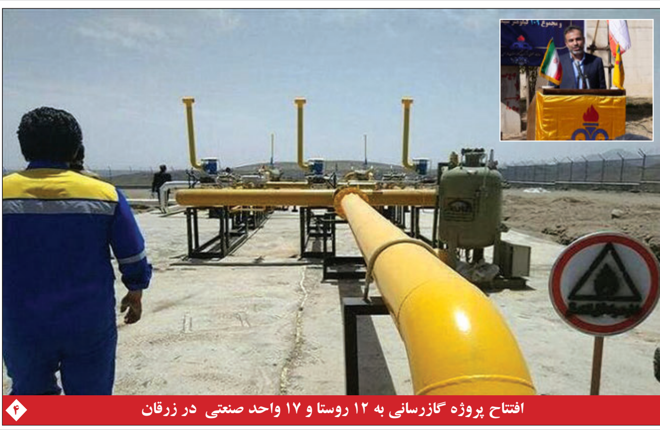
افتتاح پروژه گازرسانی به ۱۲ روستا و ۱۷ واحد صنعتی در زرگان