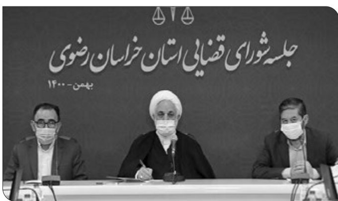
زمانبندی‌شده از کلیه واحدهای قضایی خراسان رضوی سرکشی کرده و گزارشات آن را به مرکز منتقل کنند.

وی با تأکید بر لزوم تسریع در پاسخگویی به استعلامات قاضیان ناظر زندان تذکر داد و گفت: علاوه بر ضرورت تقویت کمیته قضات ناظر زندان لازم است فرآیندی ترتیب داده شود که به نامه‌ها و درخواست‌های آنان نیز با فوریت و سرعت پاسخ داده شود. نباید شرایط به نحوی باشد که نامه و درخواست قاضی ناظر زندان مدت‌ها بدون پاسخ بماند و پاسخی از سوی اجرای احکام برای وی ارسال نشود.