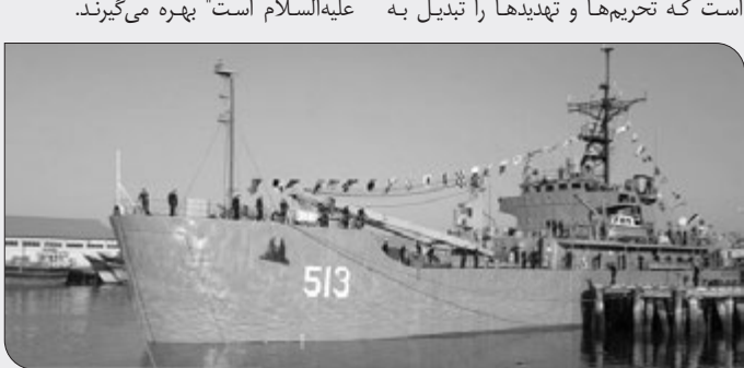
نیروی دریایی لباس طلاهداران خط شکنی است که تحریرها و تهدیدها را تبدیل به

فرصت کرده‌اند و از شعار "ماه ما امراه حسین علیه‌السلام است" بهره می‌گیرند.