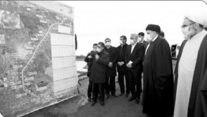
حضور رئیس‌جمهور بر مزار میرزا کوچک خان جنگلی

رئیس‌جمهور همچنین گیلان را دیار علماء، فلاسفه و سرداران رشید و پرافتخار دانست و گفت: مردم گیلان در دوران دفاع مقدس و نیز دفاع از حرم رشادت‌های چشمگیر و ماندگاری خود به نمایش گذاشتند.