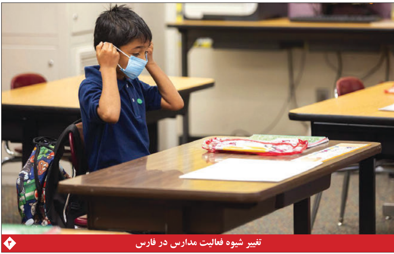
تغییر شیوه فعالیت مدارس در فارس

امام جمعه شیراز: گاهی فقط گله می کنیم، به راه حل نمی اندیشیم