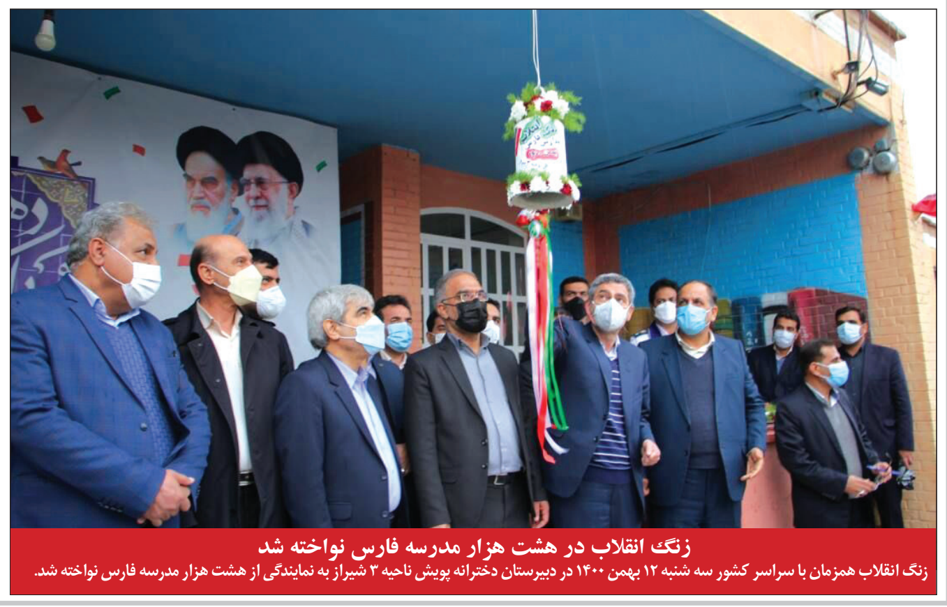
زنگ انقلاب در هشت هزار مدرسه فارس نواخته شد زنگ انقلاب همزمان با سراسر کشور سه شنبه ۱۲ بهمن ۱۴۰۰ در دبیرستان دخترانه پویان ناحیه ۳ شیراز به نمایندگی از هشت هزار مدرسه فارس نواخته شد.