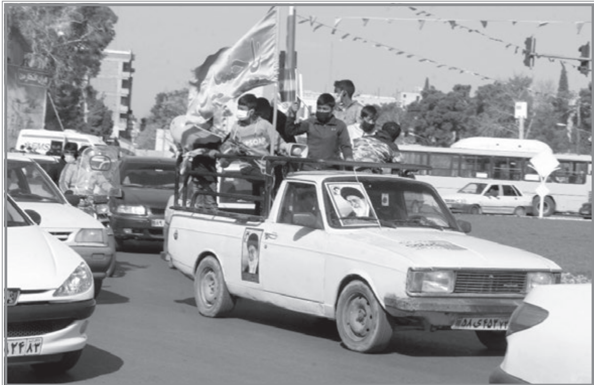
گرامیداشت ۲۲ بهمن در شیراز