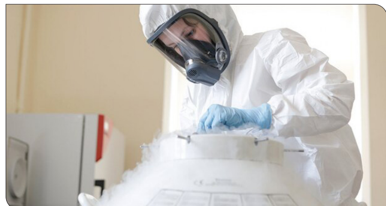
مهر: با شیوع گسترده سویه اومیکرون ویروس کرونا متخصصان گروه دارویی برکت واکسن اختصاصی این سویه را تولید کردند. بگروه دارویی برکت با رصد یافته های علمی و

دانشمندان ایرانی با توجه به سرعت بی سابقه ای انتشار اومیکرون در سطح جامعه و نیز نتایج امیدوارکننده مطالعات حیوانی، تولید انبوه واکسن مختص این سویه را شروع کرده است. همچنین، پروتکل پیشنهادی اجرای مطالعه بالینی واکسن جهت تصمیم گیری به سازمان غذا و دارو و کمیته اخلاق ارائه شده است.