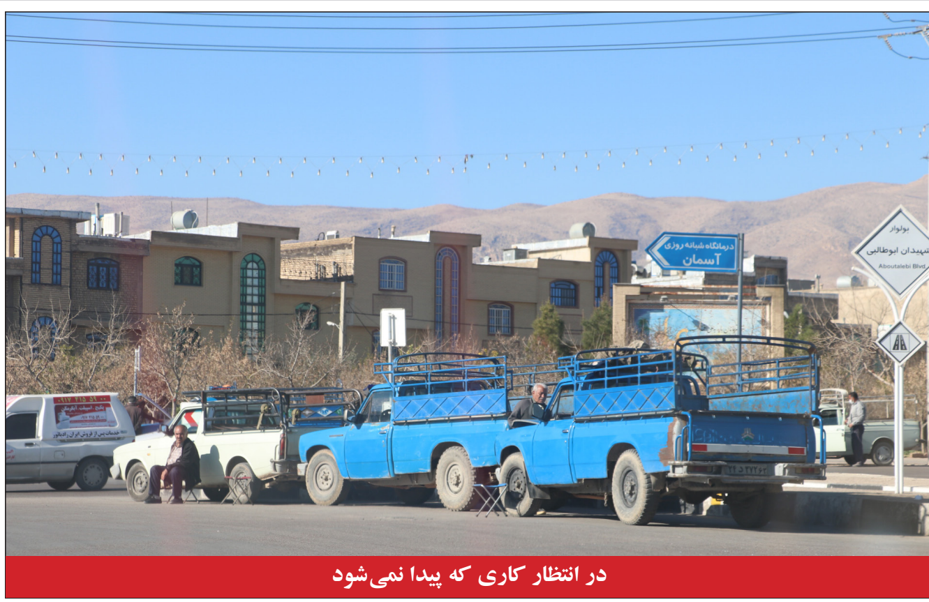
در انتظار کاری که پیدا نمی شود

استاندار تأکید کرد: لزوم تدوین برنامه ۴ ساله حوزه زیارت و گردشگری فارس