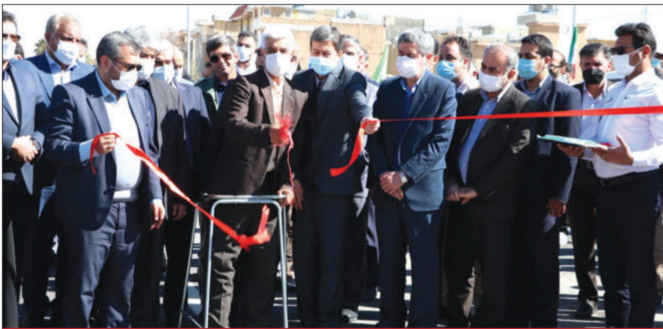
معاون عمرانی و توسعه امور شهری و روستایی وزارت کشور در مراسم گشایش پروژه های شهرداری شیراز تاکید کرد: قطار پر سرعت پروژه های عمرانی متوقف نشده است شهردار شیراز از گشایش خط ۲ مترو تا تابستان ۱۴۰۱ خبر داد