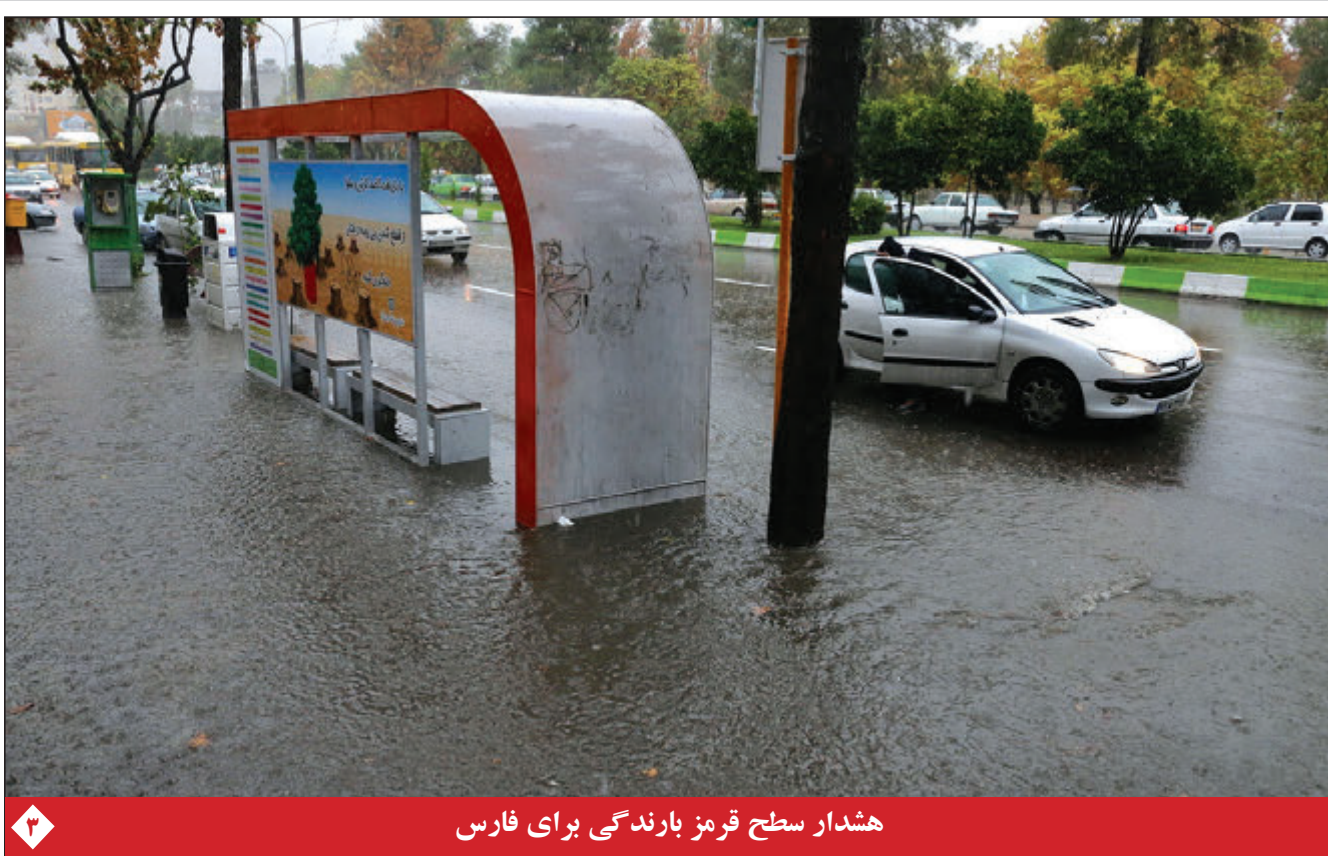
هدشار سطح قرمز بارندگی برای فارس

یک نشریه آمریکایی با تأکید بر این که ایران بیش از هر زمانی در تاریخ مدرن خود از تسلیحات بهتر و نفوذ بیشتری برخوردار است گزارش کرد که موشک های کروز ایران موازنه قدرت در خلیج فارس را تغییر داده است. به گزارش گروه بین الملل خبرگزاری فارس، هفته نامه آمریکایی «نیویورکر» در گزارشی به توانمندی نظامی و تأثیرگذاری جمهوری اسلامی ایران اعتراف کرد و نوشت که ایران بیش از هر زمان دیگری در تاریخ مدرن، بهتر و نفوذ بیشتری برخوردار است. هفته نامه نیویورکر در یادداشتی به قلم «رابین رایت» تأکید کرد که هیچ یک از رؤسای جمهور ایالات متحده نتوانسته اند نفوذ سیاسی و اهرم نظامی ایران در منطقه غرب آسیا را مهار کنند و تهدیدات نظامی مداوم «جو بایدن» رئیس جمهور آمریکا و پیشینیان وی علیه جمهوری اسلامی دیگری یک «گزینه بلند مدت جذاب یا موثر» نیست.