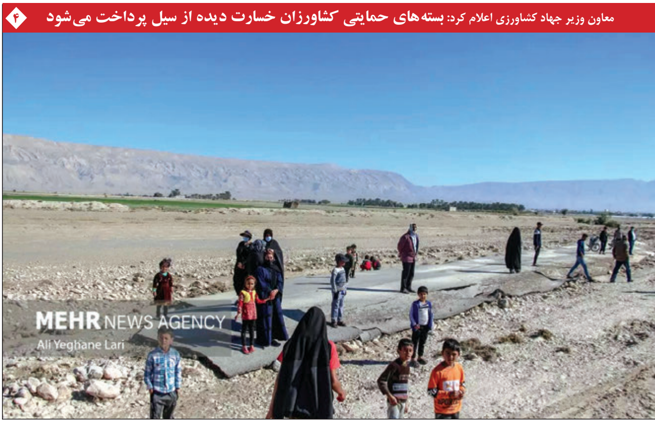
معاون وزیر جهاد کشاورزی اعلام کرد: بسته‌های حمایتی کشاورزان خسارت دیده از سیل پرداخت می‌شود