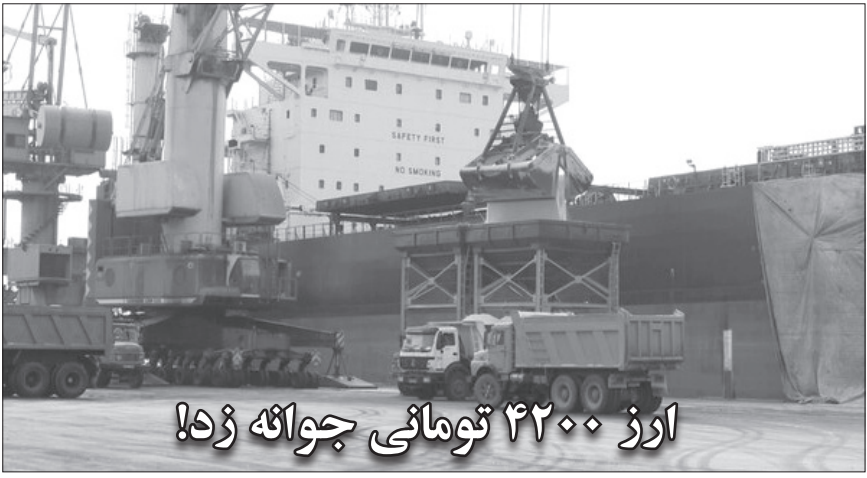
ارز ۴۲۰۰ تومانی جوازه زد!

ناشی از شرایط جوی اقدام کنند و حداقل کالا به انبار مسقف منتقل شود ولی با وجود خالی بودن دو انبار این اتفاق نیفتاده است و روی جوها حتی نایلون و چادر نیز کشیده نشد که بخشی از این حجم ۱۵ هزار تنی، در باردگی اخیر و با توجه به رطوبت بالای چاهار، سبز و فاسد شده است.