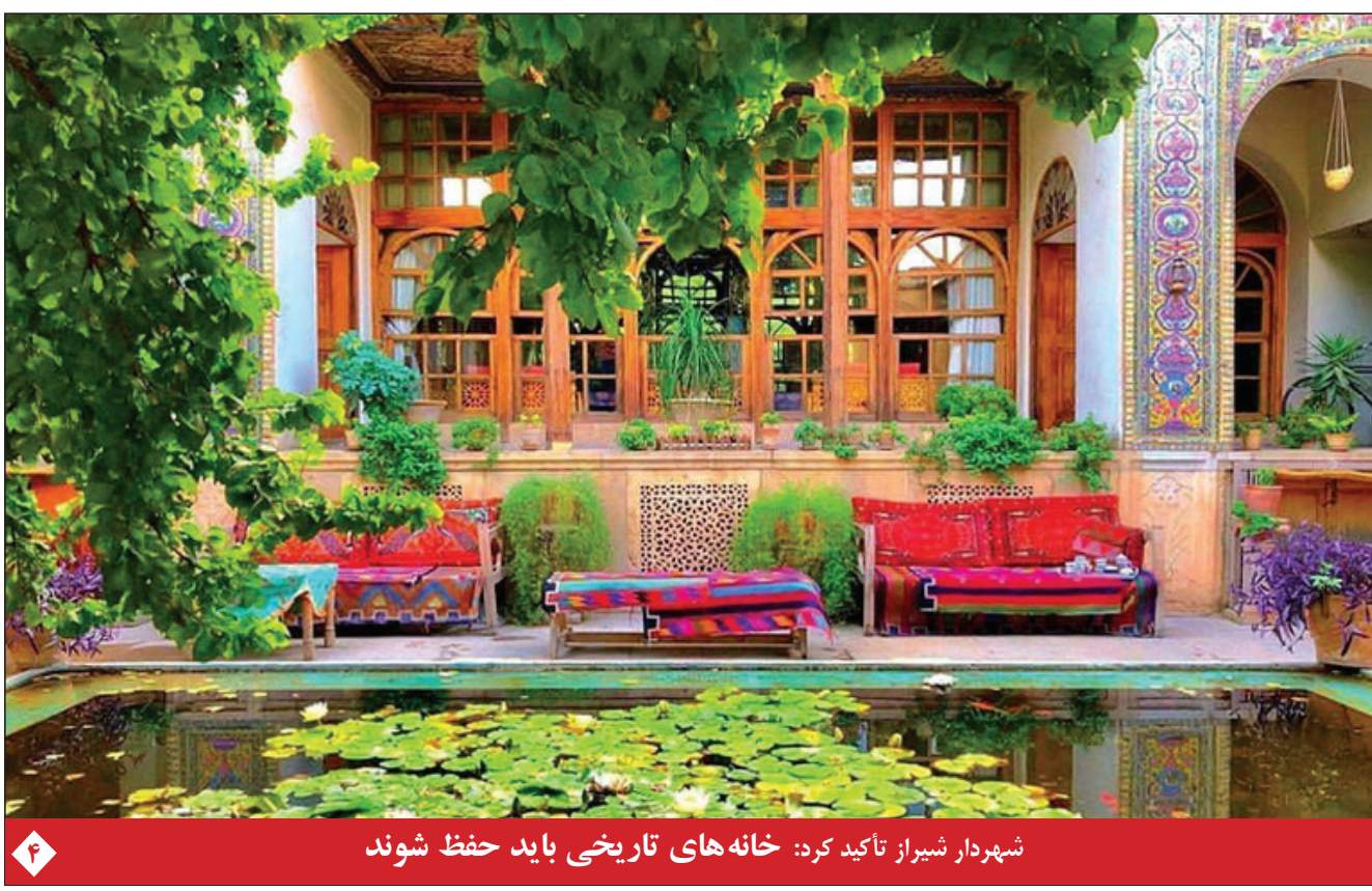
شهردار شیراز تأکید کرد: خانه‌های تاریخی باید حفظ شوند

۶ نماینده ایران در لیست بهترین‌ها قرار گرفتند ناظم‌الشریعه و تیم ملی ایران نامزد بهترین‌های فوتسال ۲۰۲۱ جهان