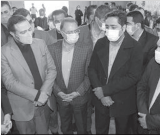
خط انتقال اقدام کند.

فتوحی افزود: در خصوص تأمین آب نیز مقرر شد شرکت‌های آب منطقه ای و آبقا انشعابی از محل خط انتقال آب سد درودزن به شهرک صنعتی دارویی اختصاص دهند.