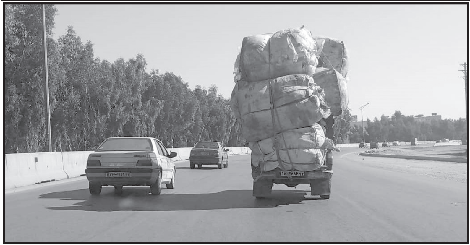
روش‌های پرخطر جایجایی بار