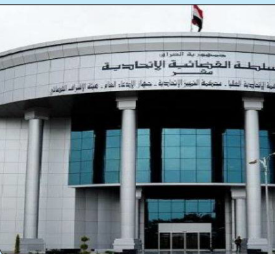
این چارچوب همچنین در بیانیه خود آورده است: ما همچنان معتقدیم که گفت‌وگوی مستقیم و متعهد به اهداف فراگیر و مشترک ملی، ساده‌ترین و سریع‌ترین گزینه برای غلبه بر بحران‌ها و تدوین راه‌حل‌های بلند مدت است.

در ادامه این بیانیه آمده است: وحدت معیارها، اعتماد میان شرکای سیاسی را تقویت می‌کند و تلاش‌های آنها را در مسیر دستیابی به اهداف مشترک ملی را متحد کرده و تهدیدات و خطرات در کمین عراق را دفع می‌کند.