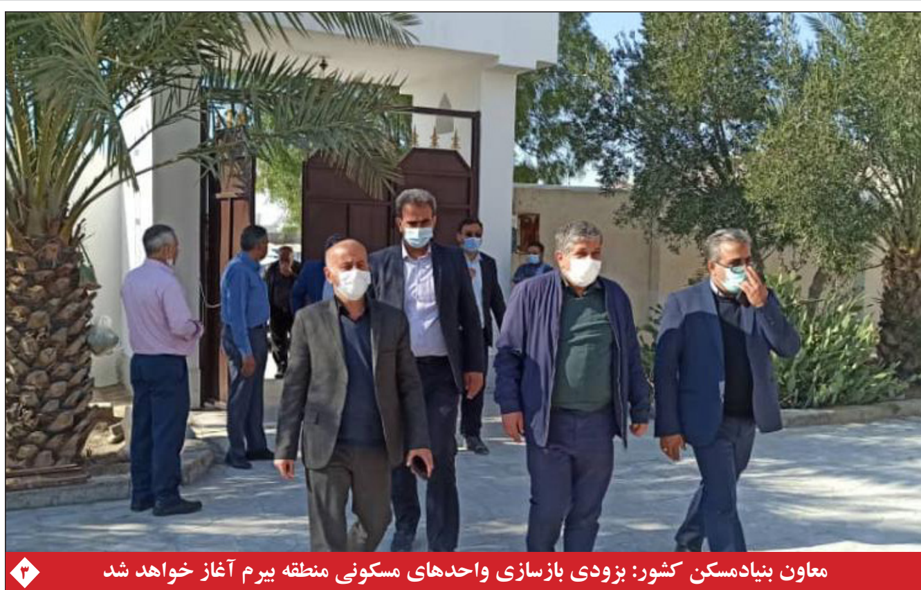
معاون بنیاد مسکن کشور: بزودی بازسازی واحدهای مسکونی منطقه بیرم آغاز خواهد شد

امام جمعه شیراز: نگاه نخبگانی قوی باید جهت گیری صحیح را برای مردم توجیه کند