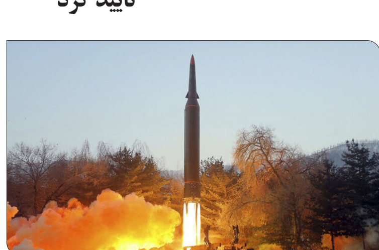
کره شمالی رسماً اعلام کرد که روز سه‌شنبه یک موشک مافوق صوت را با موفقیت آزمایش کرده است.

به گزارش ایستاد، به نقل از روسیا ایوم، خبرگزاری رسمی کره شمالی در بیانیه‌ای که شامگاه سه‌شنبه