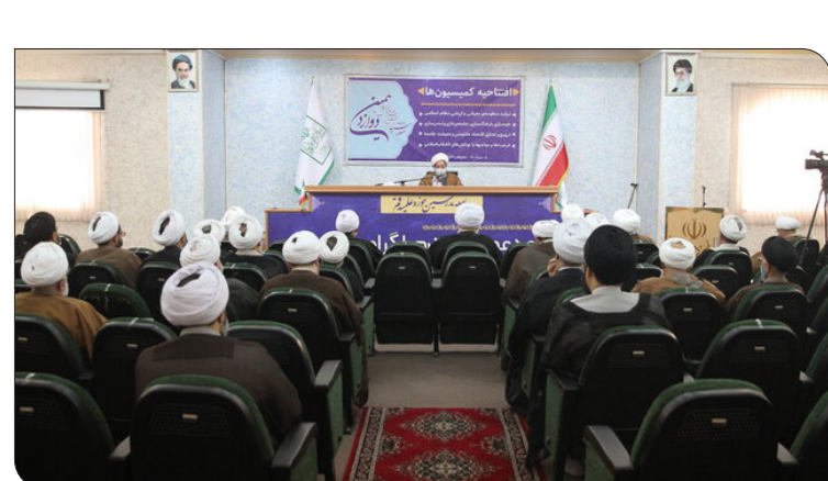
ایستاد: قائم مقام رئیس شورای عالی جامعه مدرسین حوزه علمیه قم گفت: باید تا پای جان از این نظام، در برابر دشمنان و بدخواهان، دفاع کنیم تا زمانی که این حکومت الهی در سراسر جهان فراگیر شود.

آیت الله مرتضی مقتدایی در مراسم افتتاحیه کمیسیون‌های دوازدهمین اجلاس سراسری جامعه مدرسین حوزه علمیه قم سه وظیفه اصلی حوزه‌های علمیه در راستای تحقق و دفاع از آرمان‌های انقلاب