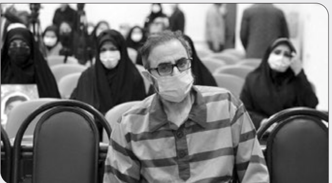
طراحی و اجرای عملیات‌های بمب‌گذاری و تروریستی متعدد در استان خوزستان و تخریب

اموال عمومی به قصد مقابله با نظام جمهوری اسلامی ایران» است. بمب گذاری در اداره مسکن و شهرسازی اهواز، عملیات بمب‌گذاری سازمان برنامه و بودجه اهواز، بمب‌گذاری در اداره محیط زیست، بمب‌گذاری انتقال خط لوله‌های نفت، و ماشهر، بمب‌گذاری در فرمانداری درفول و آبادان، برنامه‌ریزی به جهت بمب‌گذاری در دادگستری اهواز از اهم موارد تقهیم شده به متهم در جریان ابلاغ کیفرخواست بوده است. در جریان حمله این گروهک به رزه هفته دفاع مقدس در اهواز، ۲۵ نفر از شهروندان اهوازی شهید شدند.