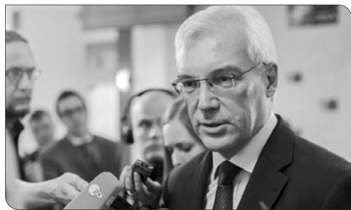
پتانسیل‌های نظامی بستگی دارد که ممکن است علیه روسیه استفاده شود. گروهسکو

براساس گزارش اسپوتنیک، در ۱۷ دسامبر، وزارت خارجه روسیه دو پیش‌نویس توافق‌نامه روسیه درباره تضمین‌های امنیتی برای ایالات متحده و ناتو را منتشر کرد. یکی از مواردی که روسیه روی آن اصرار دارد، دریافت تضمین از ناتوست که دیگر به سمت شرق پیشروی نداشته باشد و درخواست عضویت اوکراین در این ائتلاف نظامی را هم نپذیرد. جدای از آن، روسیه خواستار ممنوعیت استقرار تسلیحات تهاجمی مهم شامل تسلیحات هسته‌ای است.