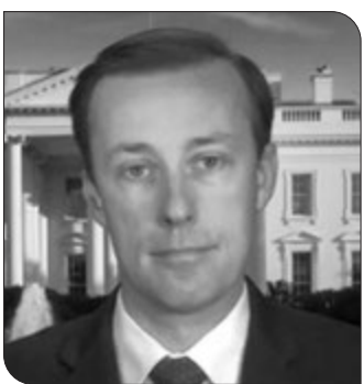
هستیم از دستیابی ایران به سلاح هسته‌ای جلوگیری کنیم.

سالیوان مدعی شد: اما همانطور که اشاره شد و آنتونی بلینکن وزیر امور خارجه آمریکا نیز اعلام کرده زمان کم است و من در اواخر ماه گذشته در اسرائیل بودم تا در صورت پیش نرفتن دیپلماسی، هماهنگی لازم را انجام دهم. مشاور امنیت ملی دولت بایدن در عین حال گفت: اما یک نکته بسیار مهم این است دلیل اینکه ما در این شرایط قرار داریم خروج دولت قبلی آمریکا از توافق هسته‌ای ایران است و ما اکنون بهای آن اشتباه فاجعه‌بار را پرداخت می‌کنیم.