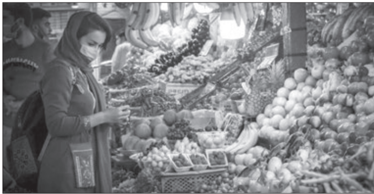
اقدام مشترک تنظیم بازار برشمرد و اظهار کرد: هدف راه اندازی این فروشگاه‌ها عرضه کالا با نرخ مصوب

برای اقبال کم درآمد است. او به راه‌اندازی فروشگاه‌هایی برای عرضه محصولات کشاورزی با همکاری سازمان میادین و تره بار شهرداری نیز گریزی زد و افزود: در روزهای آتی با شهرداری در این زمینه نشست‌های برگزار می‌شود. به گفته سرپرست سازمان جهاد کشاورزی فارس، فروشگاه‌های مذکور با هدف عرضه مستقیم محصول از مزرعه و کاهش قیمت تمام شده برای مصرف‌کننده راه‌اندازی می‌شود و امیدواریم حسب دستور استاندار تا دهه مبارکه فجر این فروشگاه‌ها در نقاطی از استان فارس مستقر شوند. دهقان‌پور عنوان کرد: ذخایر برنج وارداتی در شرکت غله فارس مناسب است و در فروشگاه‌ها به وفور پیدا می‌شود.