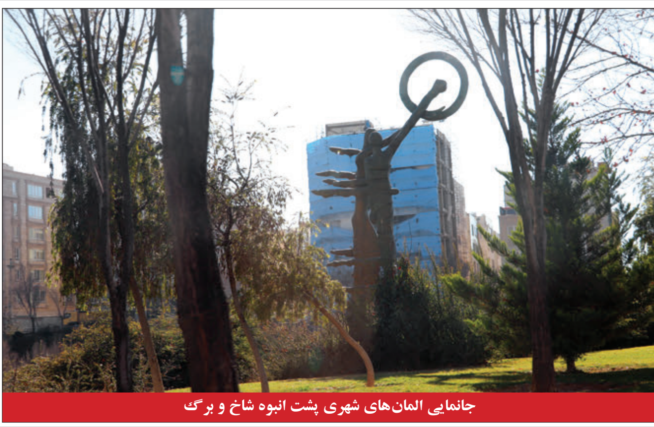
جانمایی المان‌های شهری پشت انبوه شاخ و برگ

رئیس کمیسیون اقتصاد و سرمایه گذاری شورای شهر شیراز در آیین معارفه سرپرست سازمان سرمایه گذاری شهرداری: اراده، تصمیم و اقدام سه ویژگی مهم برای مدیریت سرمایه گذاری است رئیس کل دادگستری: مجمع‌های تفریحی حاشیه رودخانه‌های فارس تخریب می‌شود شماری از شهروندان شیرازی: افتخار می‌کنیم که ساکن در محدوده شهرداری منطقه دو هستیم سرپرست شرکت توزیع نیروی برق فارس: اصلاح تعرفه برق، سبب توزیع عادلانه یارانه انرژی برق و تامین برق پایدار می‌شود قادی عضو کمیسیون تلفیق بودجه مجلس: ادامه سیاست ارز ۴۲۰۰ تومانی یعنی اجبار دولت به استقراض از بانک مرکزی و مردم