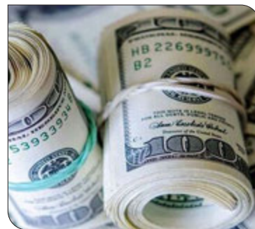
نیز در بازار آزاد از کانال ۷۰۰۰ تومان با کاهش چشمگیری و بی‌سابقه به کانال ۶۹۰۰ وارد شده که در ماه‌های اخیر بی سابقه بوده است.