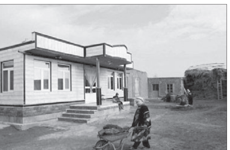
منازل آنها هم اکنون در شرف بهره برداری است که بنیاد مسکن انقلاب اسلامی شهرستان شیراز این بناها را تکمیل کرد.