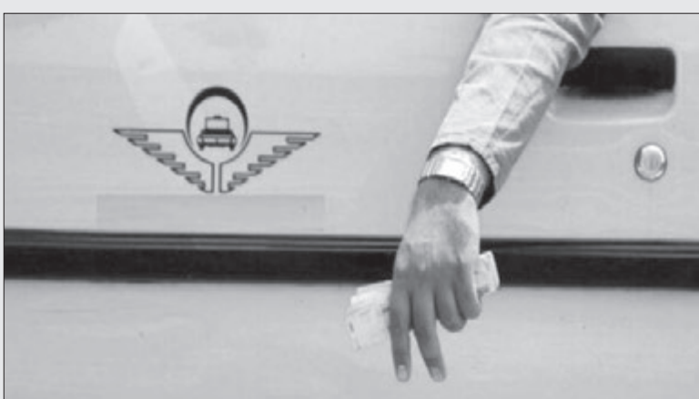
نرخ کرایه نقدی در خطوط روزانه ناوگان عمومی به ازای هر تراکنش برداشت الکترونیک کرایه (نقر میزان ۲۰۰۰ ریال افزایش یافت. سفر) در ناوگان اتوبوس و مینی بوس مبلغ ۵۰۰ ریال

به نرخ کرایه مسافر اضافه می‌گردد و شهرداری بایستی درآمد حاصله را برای ایجاد و توسعه زیرساخت سامانه برداشت الکترونیک هزینه کند. سازمان حمل و نقل مسافر می‌تواند در صورت افزایش یا کاهش طول خطوط اتوبوس و مینی بوس و همچنین راه اندازی خطوط جدید، نرخ کرایه این خطوط را متناسب با خطوط هم‌عرض و بر اساس ورودی و طول پیمایش تعیین کند. در صورت خرابی دستگاه کارتخوان در اتوبوس‌ها و مینی بوس‌ها، از مسافرن کرایه‌ای دریافت نخواهد شد و شهرداری بایستی موضوع را اطلاع رسانی کند. برای استفاده از مترو یا کارت شهروندی مبلغ ۱۳۰۰۰ ریال از کارت مسافر که در ایستگاه مبدأ و ابتدای سفر کسر می‌شود. مبلغ بلیت تک سفره (توکن یا QR) مبلغ ۲۰۰۰۰ ریال است.