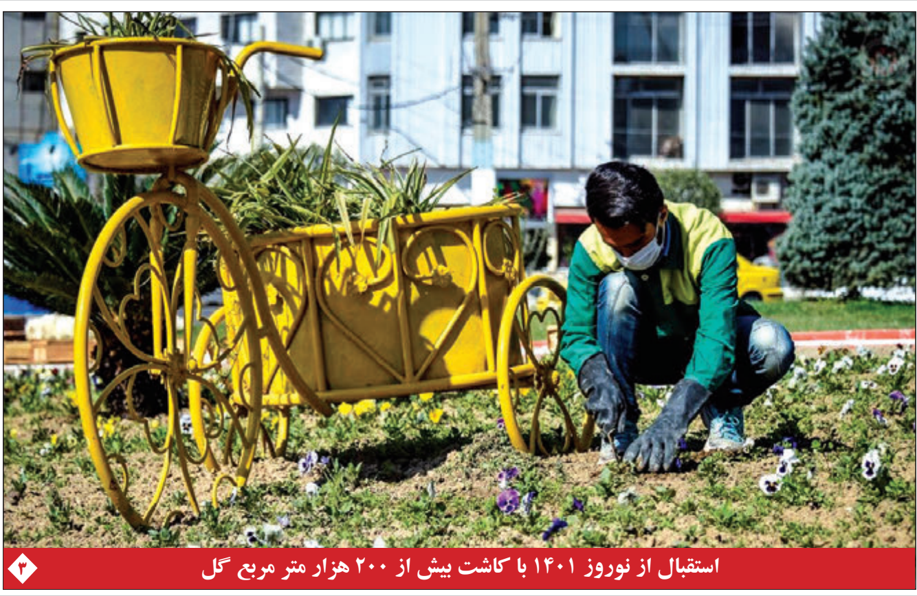
استقبال از نوروز ۱۴۰۱ با کاشت بیش از ۲۰۰ هزار متر مربع گل