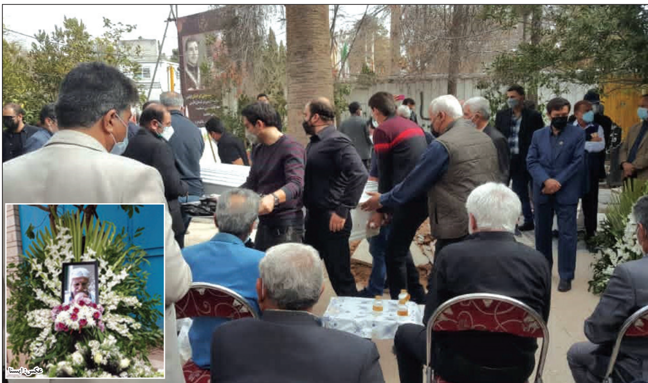
وداع فرهنگوران با زنده یاد محمدرضا پرهیزگار