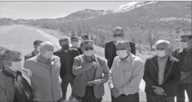
متر و ۱۵۰ متر نیز در طول مسیر اجرا شده است. ایمنی محور شامل نصب نیوجرسی و تابلوهای مدیر کل راه و شهرسازی فارس اضافه کرد: عملیات راه‌نمایی و رانندگی چند روز آینده شروع می‌شود و