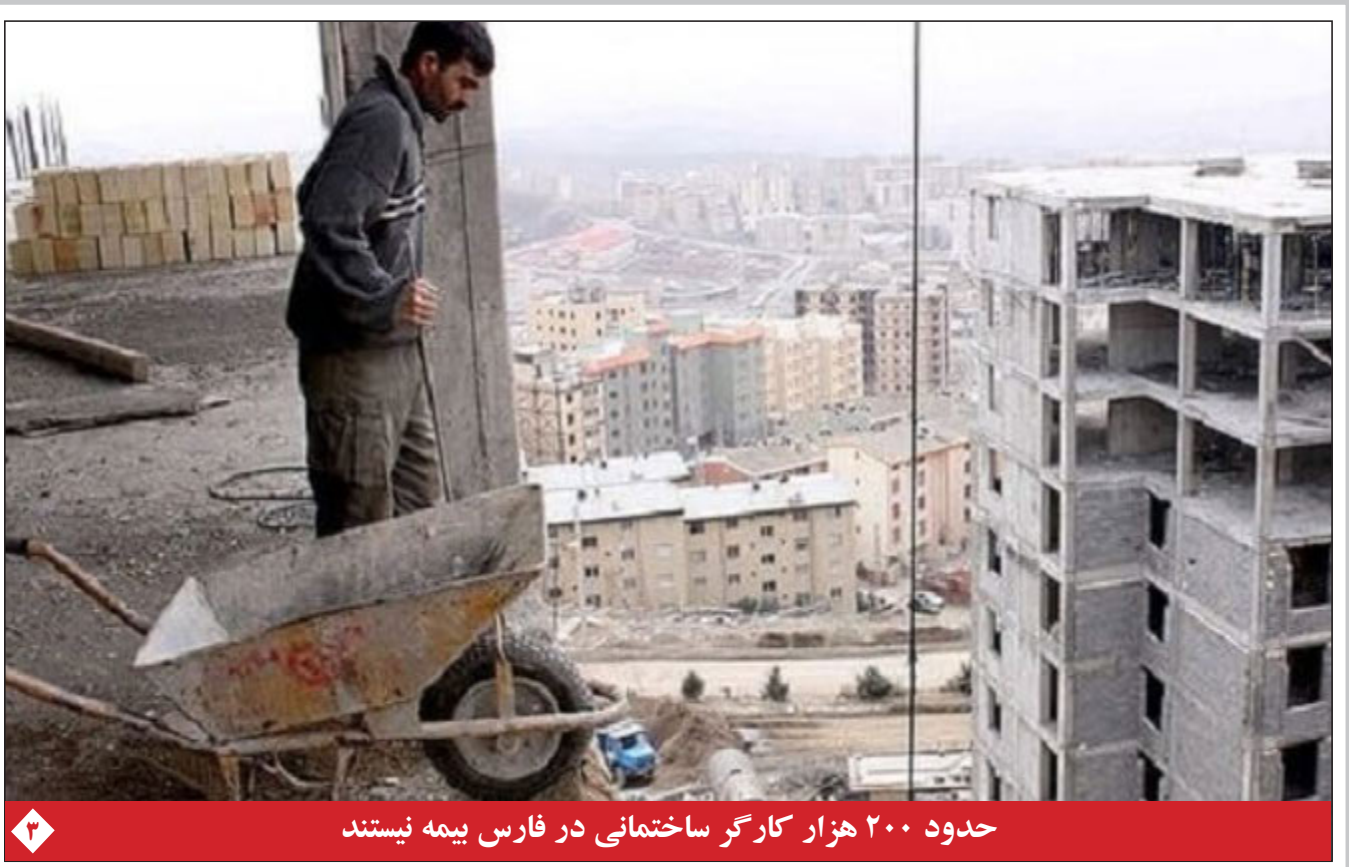
حدود ۲۰۰ هزار کارگر ساختمانی در فارس بیمه نیستند

پاسخ رهبر انقلاب اسلامی به نامه‌های رئیس دفتر سیاسی حماس و دبیرکل جهاد اسلامی فلسطین: پیروزی‌های نهایی را خواهید دید