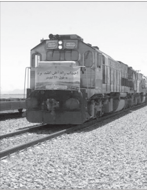
او با بیان اینکه این طرح ریلی در اواخر سال ۹۰ به قرارگاه خاتم الانبیا واگذار شد و در دو سال گذشته با توجه به اینکه در ردیف پروژه‌های چشم تولید قرار گرفت، از سرعت بسیار خوبی در عملیات

این مقام مسئول تصریح کرد: راه آهن یزد به اقلید در محور بافت به یزد منشعب می‌شود و پس از عبور از شهرهای نی ریز، ابرکو و سورمق به ایستگاه اقلید در راه آهن اصفهان به شیراز متصل می‌شود.