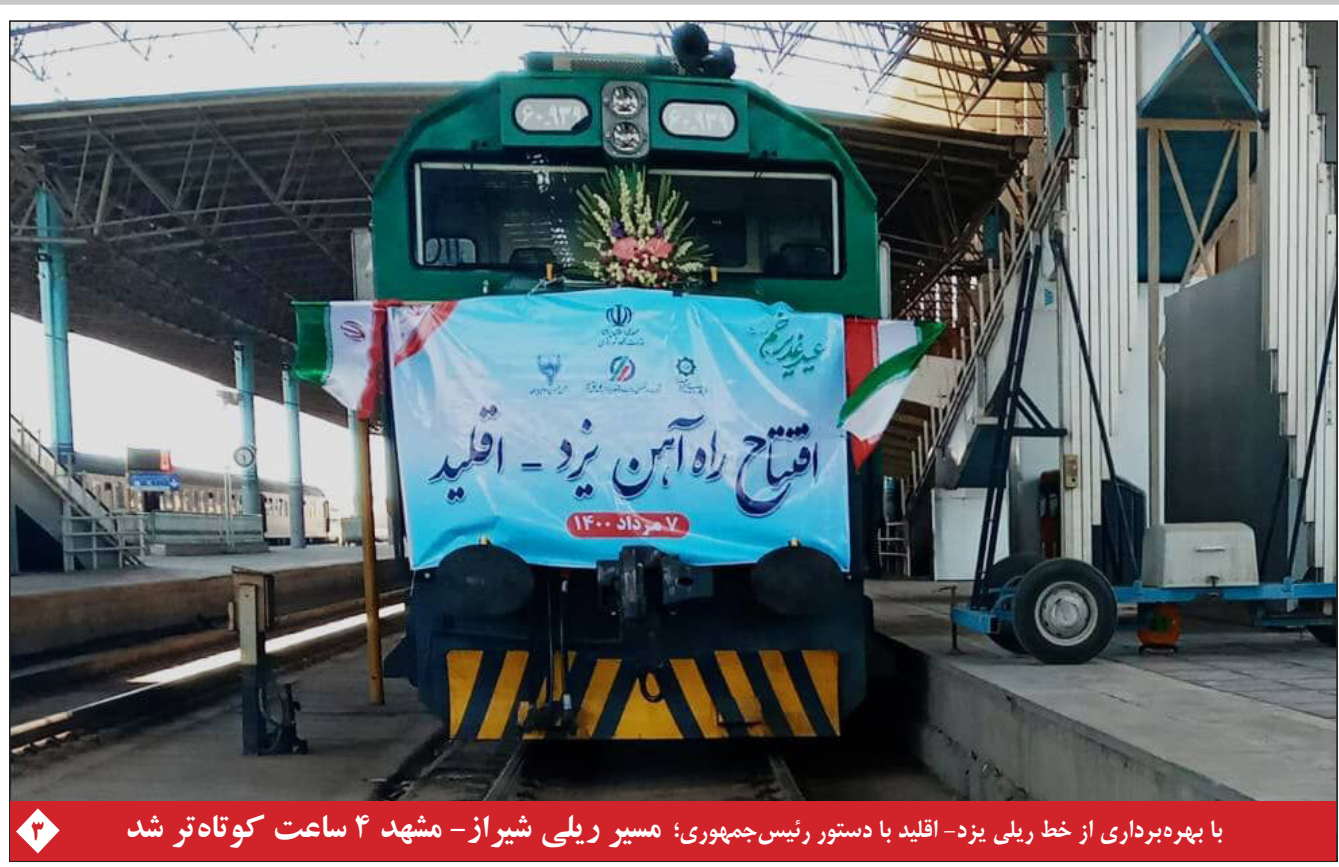
با بهره‌برداری از خط ریلی یزد- اقلید با دستور رئیس جمهوری؛ مسیر ریلی شیراز - مشهد ۴ ساعت کوتاه تر شد

واردات ۵۲۸ میلیون دلاری دارو و تجهیزات پزشکی