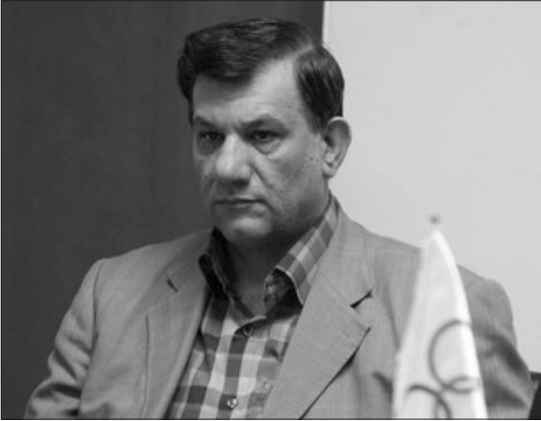
رئیس فدراسیون وزنه برداری

گفت: قضاوت‌ها در المپیک عادلانه‌تر شده و اتفاقاتی که قبلا در پشت صحنه وزنه برداری رخ می‌داد را دیگر شاهد نیستیم.