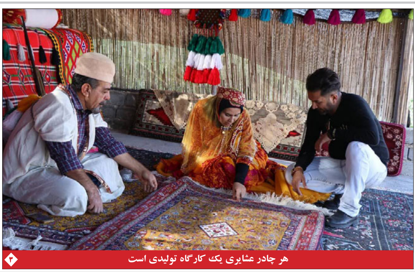
هر چادر عشایری یک کارگاه تولیدی است

رئیس‌ی در گفت‌وگوی تلفنی رئیس‌جمهور فرانسه: در هر مذاکره ای باید حقوق ملت ایران تامین شود بلومبرگ: لغو محدود تحریم‌ها گزینه جدید بایند برای احیای برجام منع حضور ایران و چند کشور در حج عمره رایان کروکر: جنگ داخلی طولانی در انتظار افغانستان است سفیر جدید انگلیس در تهران: از بازگشت به ایران هیجان زده‌ام کرونا باز هم در ایران رکورد زد