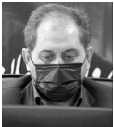
معاون پژوهش، برنامه‌ریزی و توسعه منابع آموزش و پرورش فارس نیز در این جلسه گفت: امسال

۲۲ هزار معلم شاخص‌های تعیین شده معلمان نمونه را تکمیل نمودند که با داوری‌های انجام شده در سطح مدرسه از این تعداد ۲ هزار و ۸۰۰ نفر منتخب منتظر اعلام شدند که ۲۱۹ نفر از آنها به مرحله استانی راه یافتند.