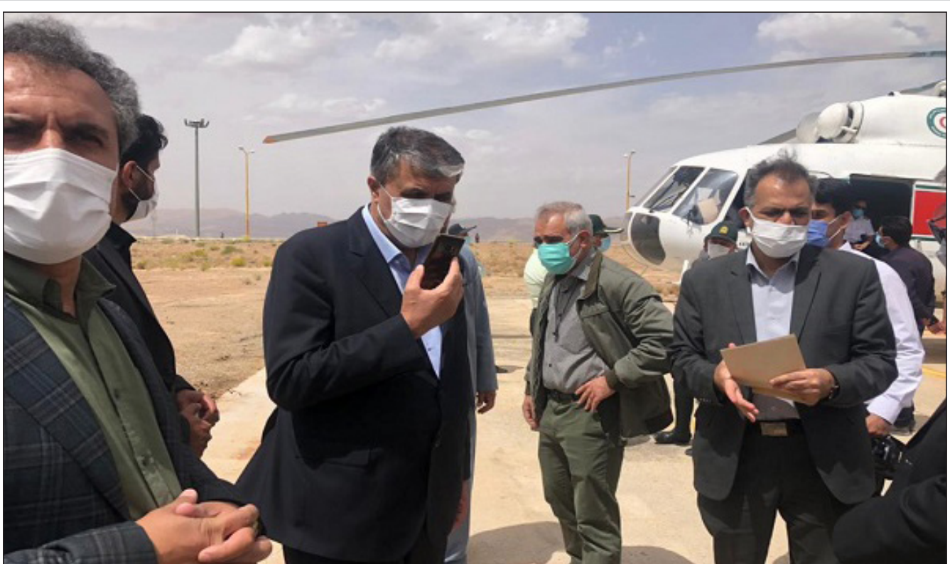
بازدید وزیر راه و شهرسازی از ایستگاه راه آهن اقلید

روحانی: کرونا را دستمایه مسائل سیاسی و انتخاباتی قرار ندهیم