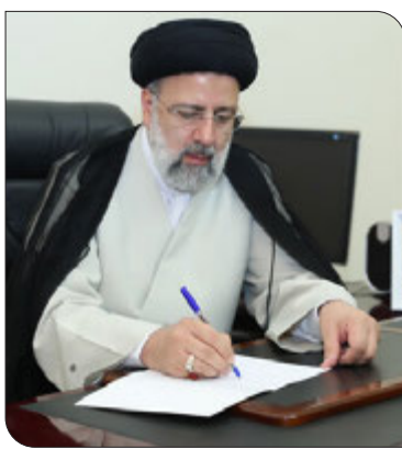
تشخیص مصلحت نظام، موجب اندوه و تأثیر عمیق گردید.

این فرمانده بسیجی، متعهد و باخلاص، سالیان متمادی از زندگی پر بار خود را در سنگرهای مختلف خدمتگزاری، پاسداری و دفاع از ارزش ها و آرمان های انقلاب و نظام اسلامی سپری کرد و دو دهه در جایگاه ریاست ستاد کل نیروهای مسلح جمهوری اسلامی ایران، به طور صادقانه خدمت نمود. این جانب این ضایعه را محضر فرماندهی معظم کل قوا، ملت شریف ایران، نیروهای مسلح و همه دوستداران ایشان و به ویژه خاندان ارجمند فیروز آبادی تسلیت گفته و در سالروز شهادت سید الساجدین، از درگاه خداوند متعال برای آن سفر کرده علو درجات و همجواری با همزمان شهادت و برای عموم بازمانگان صبر و سلامتی مسالت دارم.