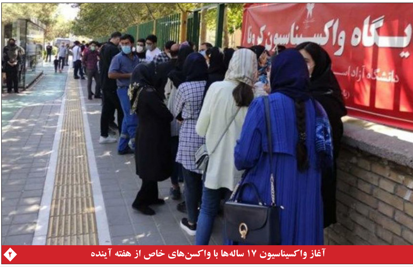
آغاز واکسن‌سازی ۱۷ ساله‌ها با واکسن‌های خاص از هفته آینده