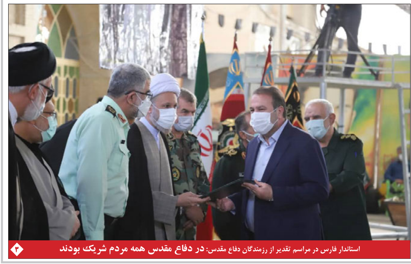
استاندار فارس در مراسم تقدیر از رزمندگان دفاع مقدس: در دفاع مقدس همه مردم شریک بودند