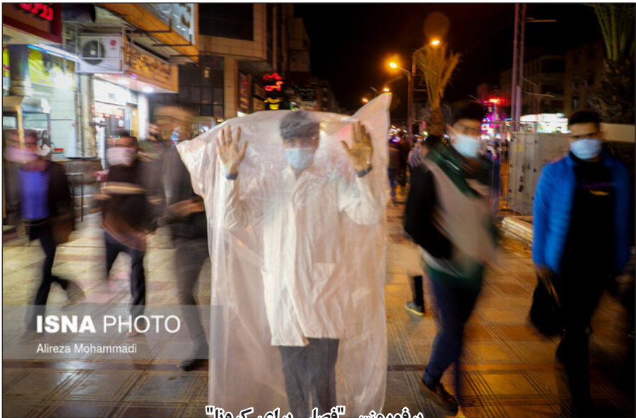
پرفورمنس "فصلی برای کرونا"

او همچنین درباره مشکلات حوزه هنر در دوران کرونا این چنین ابراز عقیده کرد: «در شهرستان‌های ایران که البته بستگی به استانش هم دارد، اصلاً آموزشی در کار نیست که ما بخواهیم نسبت به آن انتقادی وارد کنیم.